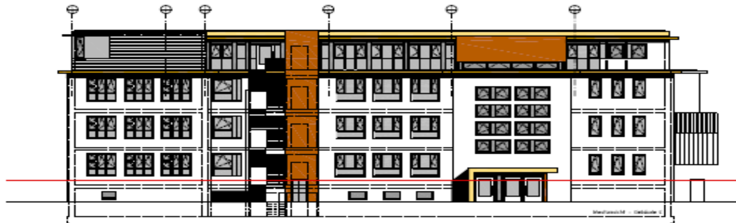
Ansicht Haus C neu